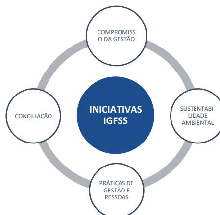
Fig. 2 – Compromisso com a sustentabilidade

O IGFSS prevê, para 2020, um conjunto de iniciativas que refletem o compromisso expresso e o alinhamento com as iniciativas e projetos definidos no âmbito da Rede PorTodos, designadamente os indicadores de sustentabilidade definidos com base na Global Reporting Initiative (GRI) 2 e nos ODS.